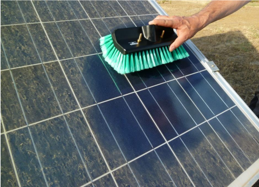
Bild 5: Detail von Schmutzschicht und Rahmenabstand bei der PV-Anlage in Castura/Spanien. Auch im Detailbild ist keine Randverschmutzung erkennbar.

Das Ziel des erwähnten EU-Projektes war die Erforschung der notwendigen Grundfunktionen und erste Tests mit einfachen Funktionsmustern von autonomen Service-robotern an realen Anlagen. Bei der PV-Anlage in Castuera wurde ein Teil der Anlage mit einem solchen Funktionsmuster des von den Projektpartnern entwickelten PV-Servitor-Roboters gereinigt. Ein anderer Teil wurde zu Vergleichszwecken manuell gereinigt (siehe Bild 6). In den meisten Fällen wurde nur die untere Reihe geputzt und die Reinigungswirkung durch Vergleich der Leistung der unteren und der oberen Reihe bestimmt. Da noch nicht alle Patentanträge definitiv bereinigt sind, kann leider kein Bild des Roboters gezeigt werden.