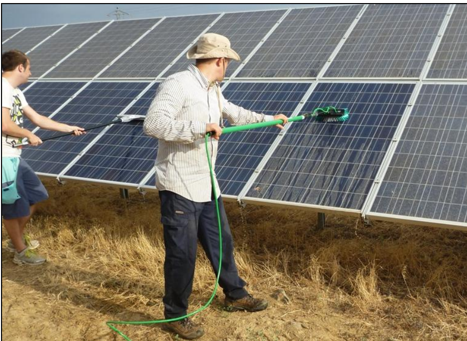
Bild 6: Manuelle Reinigung von Teilen des Solar-generators der PV-Anlage in Castuera. In einem ersten Schritt werden die Module mit einer Bürste und Wasser gereinigt (rechts), danach wird das Wasser mit einem Gummischerer entfernt.

Das Ziel des erwähnten EU-Projektes war die Erforschung der notwendigen Grundfunktionen und erste Tests mit einfachen Funktionsmustern von autonomen Service-robotern an realen Anlagen. Bei der PV-Anlage in Castuera wurde ein Teil der Anlage mit einem solchen Funktionsmuster des von den Projektpartnern entwickelten PV-Servitor-Roboters gereinigt. Ein anderer Teil wurde zu Vergleichszwecken manuell gereinigt (siehe Bild 6). In den meisten Fällen wurde nur die untere Reihe geputzt und die Reinigungswirkung durch Vergleich der Leistung der unteren und der oberen Reihe bestimmt. Da noch nicht alle Patentanträge definitiv bereinigt sind, kann leider kein Bild des Roboters gezeigt werden.