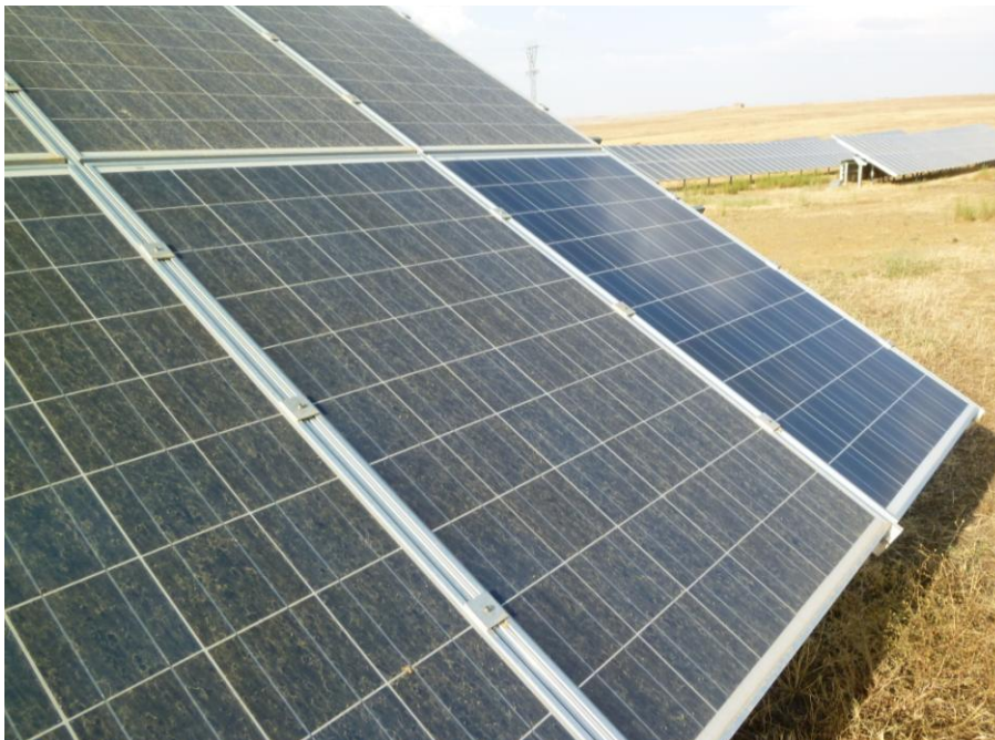
Bild 4: Teilansicht einiger Module bei der PV-Anlage in Castuera. Das Modul rechts unten ist bereits gereinigt. Es ist keine Randverschmutzung erkennbar.

Da wegen Transport- und Zollproblemen nicht allzu viele Messgeräte mitgenommen werden konnten und Unterbrüche zwecks Kennlinienmessung aus Sicht der Betreiber unerwünscht waren, wurde der Reinigungseffekt einerseits durch den Vergleich der Strangströme vor und nach der Reinigung eines der beiden Stränge an einer Anlage und andererseits durch den Vergleich der am Wechselrichter angezeigten Leistung benachbarter Anlagen beurteilt (Messung beider Anlagen vor und nach der Reinigung einer ganzen Anlage, Vergleichsanlage bleibt ungereinigt). Erstaunlicherweise betrug der Gewinn durch die Reinigung trotz deutlich sichtbarer Verschmutzung in der Fläche maximal etwa 3%. Bei dieser Anlage fehlte eine Randverschmutzung, sie hätte aber wegen relativ grossen Randabständen ohnehin keinen Einfluss gehabt. Bild 4 und 5 zeigen die in Castuera vorhandene Verschmutzung.