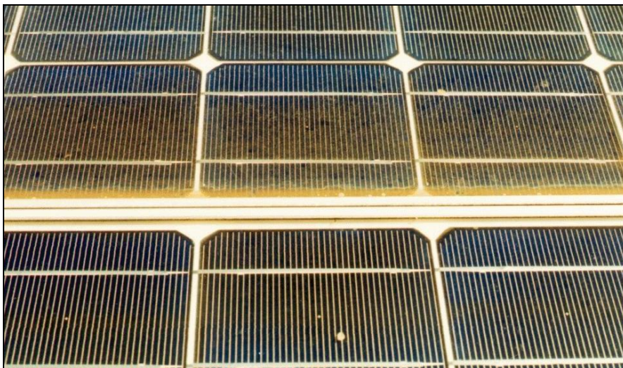
Bild 2: Detailansicht der Verschmutzung des PV-Generators von Bild 1 mit gerahmten Modulen Siemens M55 [3].

Durch Regen und Schnee wird ein grosser Teil der Schutzablagerungen (Staub, Pollen, Vogel- und Insektenkot usw.) jeweils abgewaschen. Dabei bildet sich bei gerahmten Modulen beim unteren Rahmen wie bei einer Flussmündung eine kleine Ablagerungszone für diesen Schmutz. In dieser fließt das Wasser nicht sofort ab, sondern es verdunstet allmählich und einen Teil des Schmutzes bleibt als Ablagerungsschicht zurück. Falls der Abstand zwischen Zellen und Rahmen allzu klein ist (wie beim M55), wird nach einer gewissen Zeit deshalb ein Teil der untersten Zellenreihe abgedeckt, was einen entsprechenden Minderertrag des Moduls zur Folge hat (siehe Bild 1 und 2). Messungen an der 1993 erstellten 60 kWp-PV-Anlage der BFH-TI in Burgdorf mit ca. 1100 Modulen M55 (mit 4 Zoll Zellen, meist in "Landschafts-Montage" mit Anstellwinkel 30^\circ ) zeigen denn auch einen Minderertrag von bis zu 10%, wenn seit der letzten Reinigung etwa 4 Jahre verstrichen sind [1], [2], [3] (siehe Bild 3).